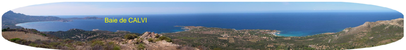
Baie de CALVI